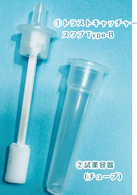
①トラストキャッチャー スワブ Type-B